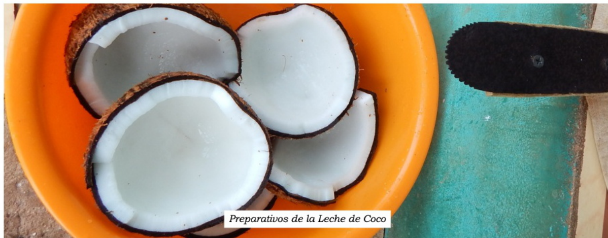
Preparativos de la Leche de Coco

Marilaura Cajar / Diseñadora gráfica y publicista