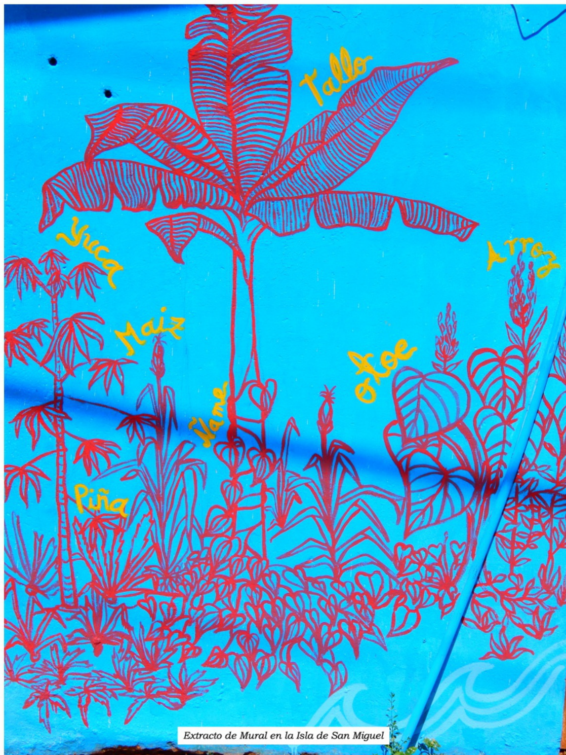
Extracto de Mural en la Isla de San Miguel