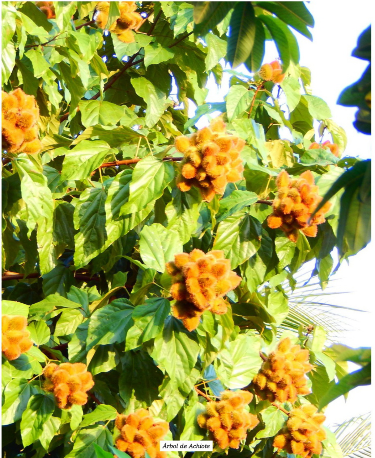
Árbol de Achiote